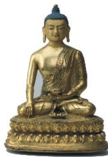
降魔釈迦牟尼世尊像

上の筒の中に「経典」が納められており、時計回りに一度回転させると、「経典」を一度読んだことになるという便利なもの